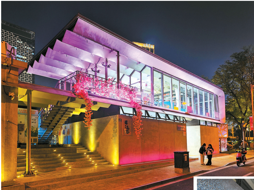
▶ 静安延安中路绿地广场公园(静安段)公厕将园林设计理念贯穿其中