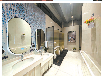
▶ 苏州河樱花谷公厕内景