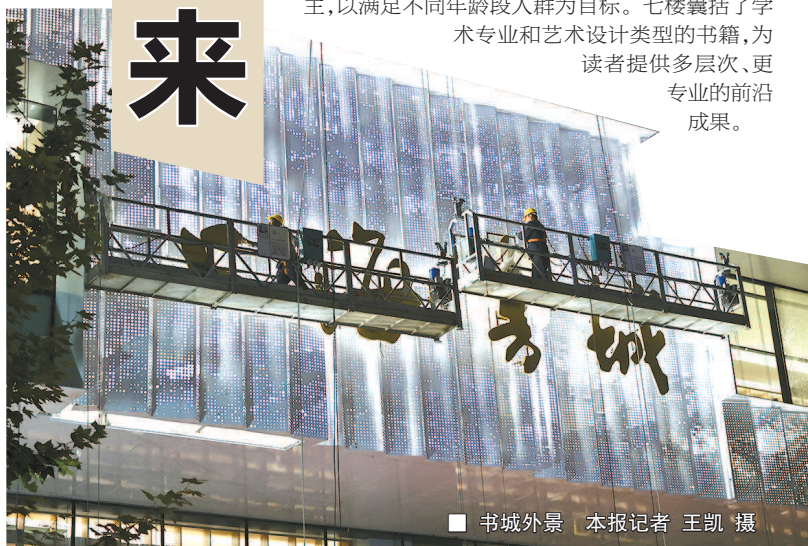
■ 书城外景