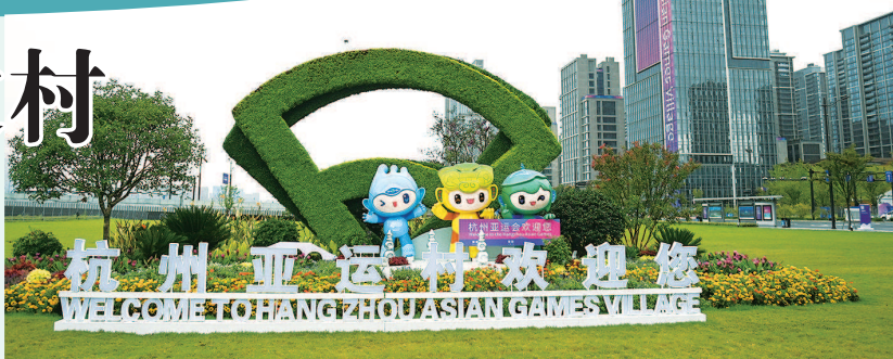
▲ 杭州亚运村喜迎八方来客

论地段，亚运村所在的区域，是杭州现在和未来主力发展的城区。这里有作为G20峰会主会场的国际博览中心，有中国数字音乐基地，对岸是代表钱塘新气象、新未来的钱江新城，如今再借亚运会的舞台，