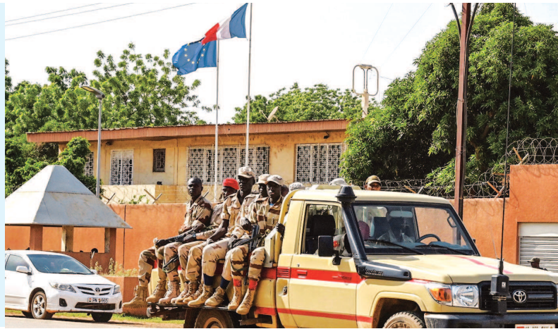
尼日尔军车经过法国使馆门前