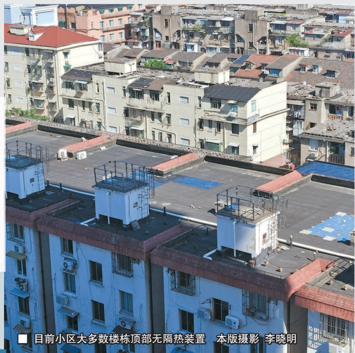
目前小区大多数楼栋顶部无隔热装置

◀ 早上9点户外温度29℃,小区21号楼601室陈女士家中的空调设置在25℃运转,可记者现场实测室内温度为33.1℃