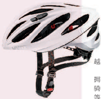
优维斯 boss race 轻量级自行车头盔

转眼间,9月就要来临了,骑行人最期待的金秋骑行季也越来越近了。被强烈的紫外线“封印”住的骑行热情又开始萌动了。你的追风装备准备好了吗?安全可靠的骑行装备,不仅能让你的旅途更加舒心,还能让你更加自如地享受骑行带来的乐趣。