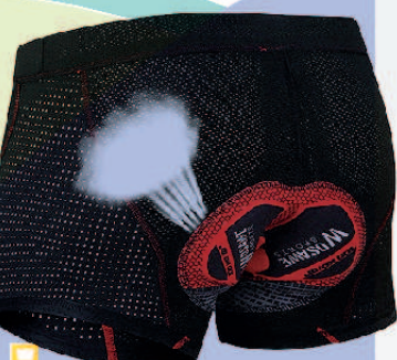
WOSAWE 山地自行车骑行内裤