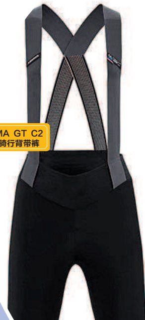
阿索斯 UMA GT C2 透气保暖骑行背带裤