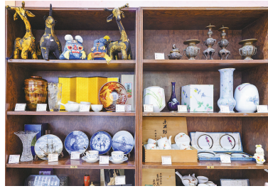
■ 九华堂展架