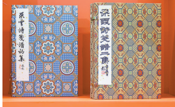
◀ 《朵云轩诗笺谱初集》和《朵云轩诗笺谱二集》