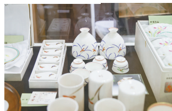
▶ 香兰社中古瓷器