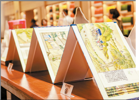
▲ 经龙装《清·孙温绘程甲本图文典藏版红楼梦》