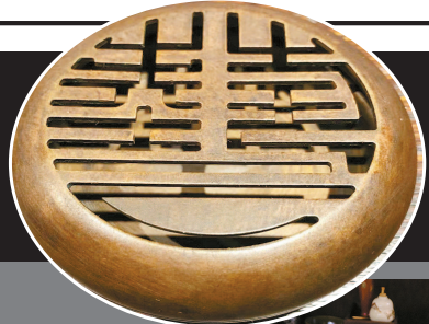
◀ 艺术书坊定制铜香炉