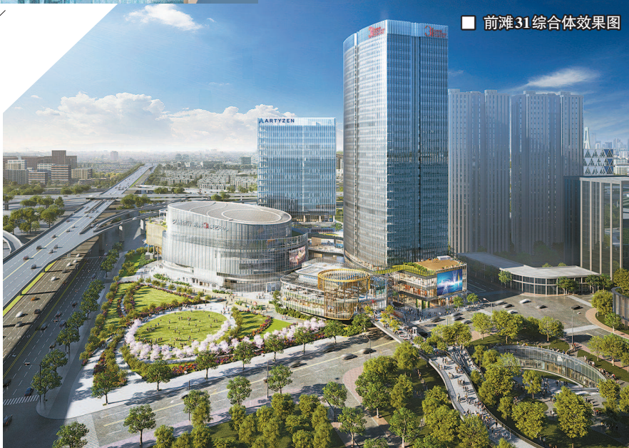
■ 前滩31综合体效果图