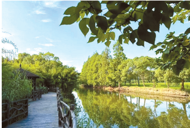
“龙鼎千树园”成为远近闻名的“树文化露天博物馆”