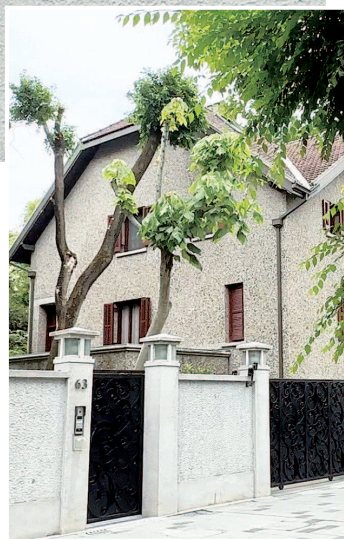
■ 思南路洋房换新颜

善》杂志停刊，曾朴后来回到家乡常熟，潜心园艺，游憩养病，直到1935年因病去世。