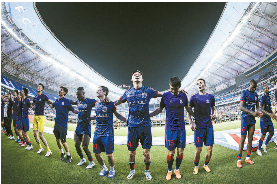
申花队员赛后向球迷致意