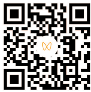
视频 浏览 扫码看戴伟浚申花主场