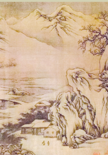
▲ 王维 江干雪霁图(局部)