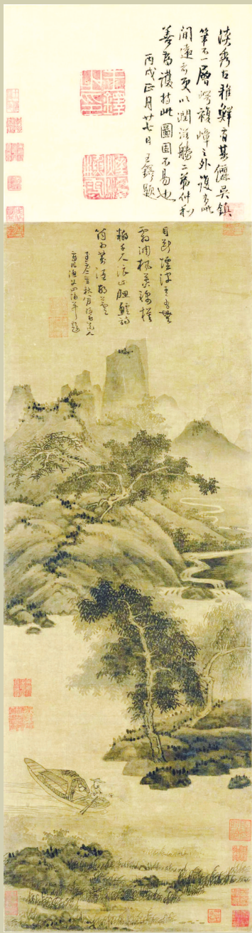
▲ 吴镇 渔父图

现在画院多如牛毛,人人都要当专业画家,还口口声声称自己是文人画,甚至大言不惭地提出新文人画,难免流于浅薄。