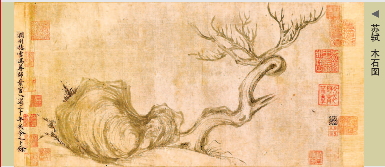
▲ 苏轼 木石图