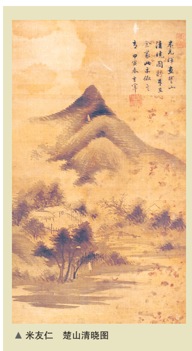
▲ 米友仁 楚山清晓图

绘画形象的书法,趣味盎然,以前文献上提到的用笔、笔法,是绘画形象的线条画,应该认作描法如游丝描、高古游丝描、吴带当风和曹衣出水的区别,只在于吴带当风线条的提按性也即顿挫,当然已具备