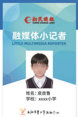
(图片仅作参考,以实物为准)

表现突出的学员将获得“优秀学员”称号 参加新民晚报品牌活动 全年都有机会跟随记者采访