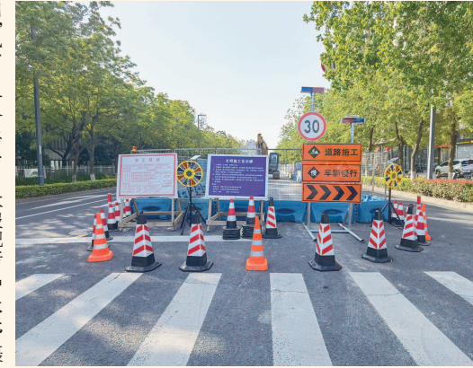
别,减少了安全隐患