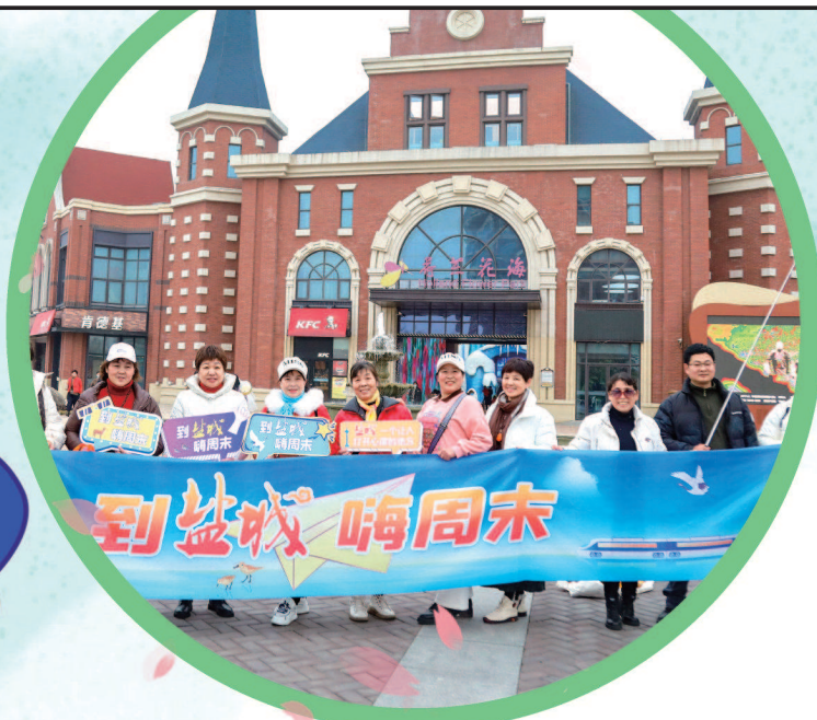
▲把“嗨”的美好体验定格

盐城将用心、用情打造高质量文旅,欢迎广大外地游客“到盐城嗨周末”。我们相信,未来,盐城不只是一人们周末的出游选择,更会成为更多人365天的出游选择。