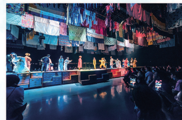
▲荷兰花海《只有爱·戏剧幻城》

盐城四季皆美景,处处都是“打卡”地,刻刻皆有“打卡”时!且不说春天的繁花似锦,夏天的荷花连天,秋天的菊花灿烂,冬天的梅花傲雪,就是在当下春光旖旎之时,樱花月、桃花节、梨花节,不仅美不胜收,更预示着收获,人民的幸福。在荷兰花海,地上长花、湖中生花、树上开花,色彩鲜明;在大洋湾,各式品种浪漫樱花,次第盛开,既可漫步林间小道,置身花丛,暗香拂面,也能飞行空中,俯瞰花海……盐城,已是全国各地摄影爱好者的心仪之地之一,在盐城,一年四季都能发现美,并沉浸其中,“打卡”盐城“嗨”周末,必定会更“嗨”!