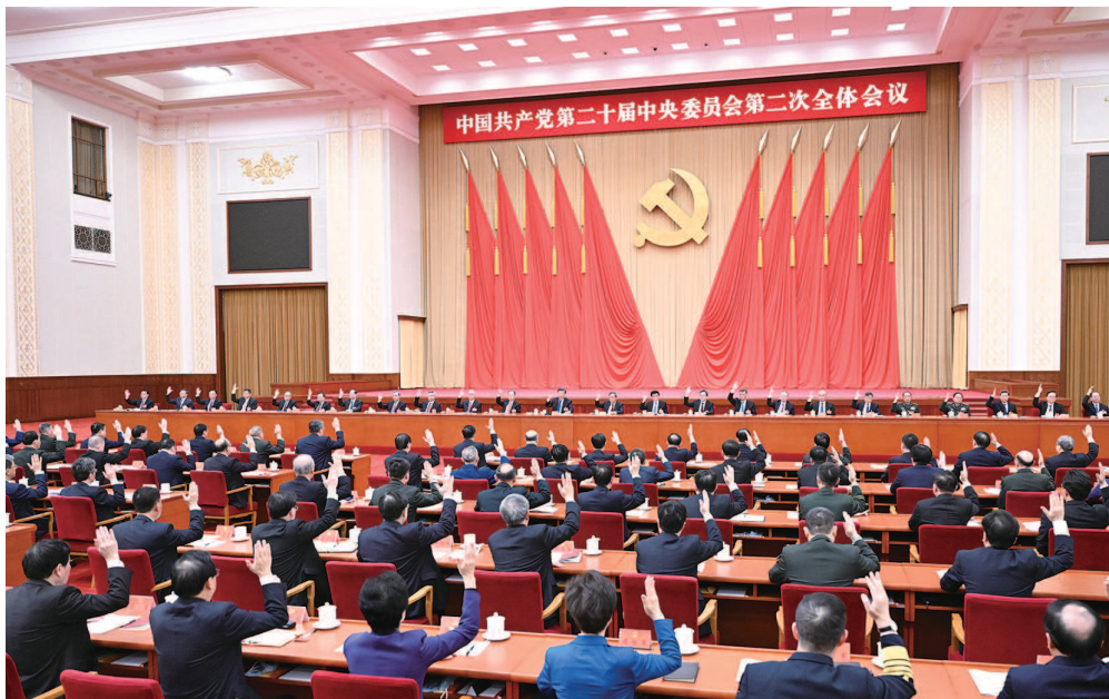
中国共产党第二十届中央委员会第二次全体会议在京举行