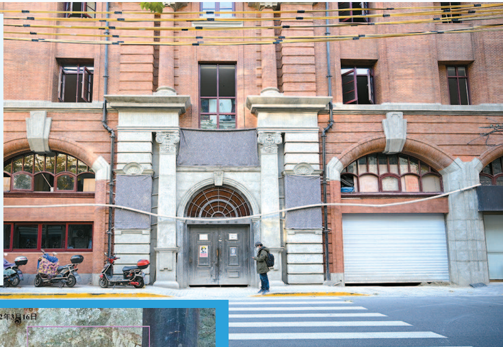
浦光大楼目前正在保护性修缮中