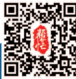
本版编辑/蒋俭 视觉设计/戚黎明