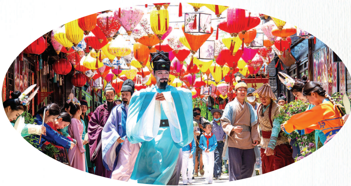
沉浸式演出《范仲淹》