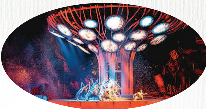
沉浸式秀演《小镇有喜》