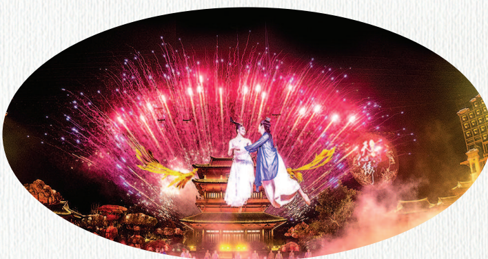
仙幻实景秀《天仙缘》

多年来,九龙口景区一直以传承淮杂文化、保护绿色生态、发展文化旅游为己任,始终以历史文化遗产再利用为原则,探索各种“非遗+”的融合模式,致力将九龙口打造成“非遗+演艺”、“非遗+美食”“非遗+文创”“非遗+研学”为特色的文旅融合的非遗旅游景区。