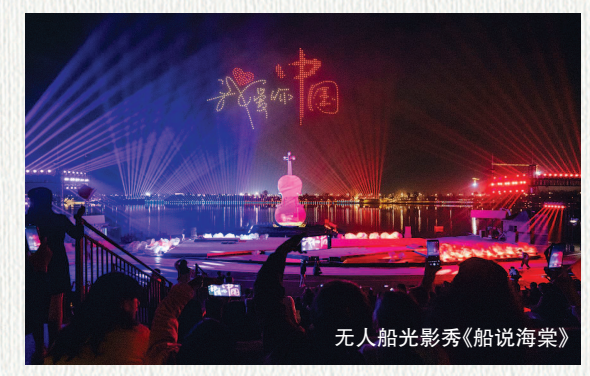
无人船光影秀《船说海棠》

小体量激活大市场。一个个各具特色的演艺新空间“嵌”于百姓生活之中,与城市更新同频共振。“盐城有戏”,邀你共赏!