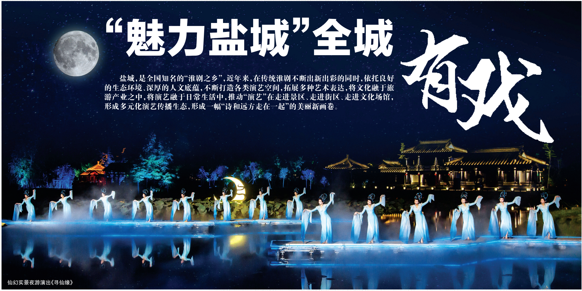
仙幻实景夜游演出《寻仙缘》