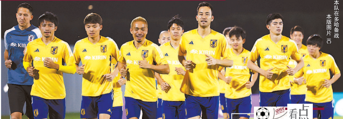
日本队在多哈备战 本版图片(一)

世界杯8个小组中,E组是实力最平均的。这个小组,拥有两支世界杯冠军球队德国和西班牙,另外还有野心勃勃的日本。德、西两强都不在自己的巅峰期,这个组的争夺会异常激烈。