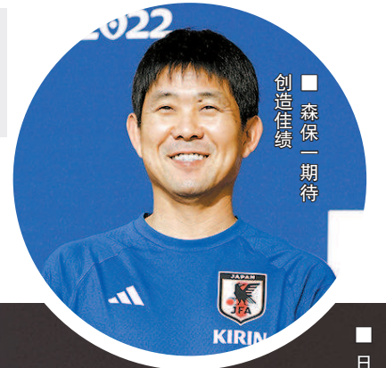
森保一期待创造佳绩