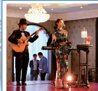
■ 上海影视乐园官宣启动沉浸式项目