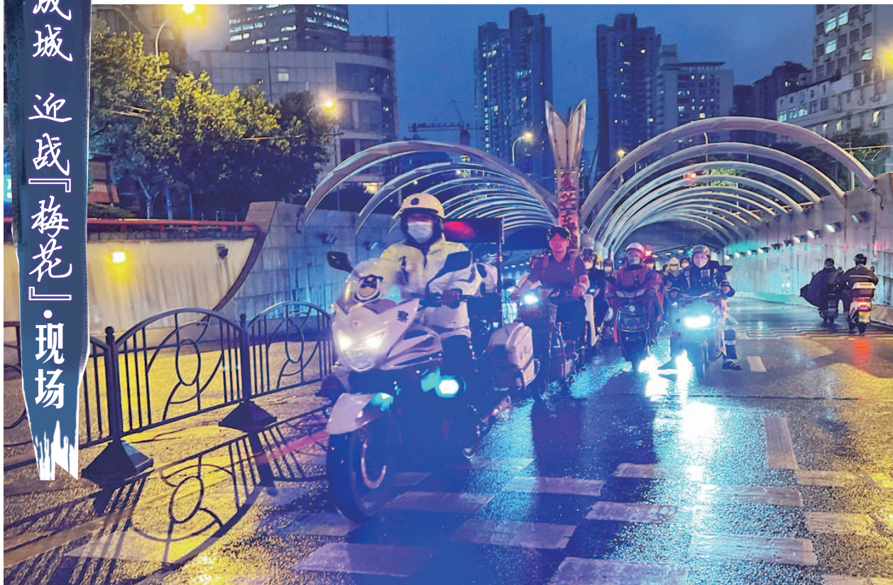
■ 昨日晚高峰,黄浦公安分局交警支队民警为非机动车过复兴东路隧道开道