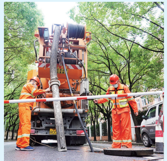
■ 今天上午,市政工作人员冲洗疏通下水道