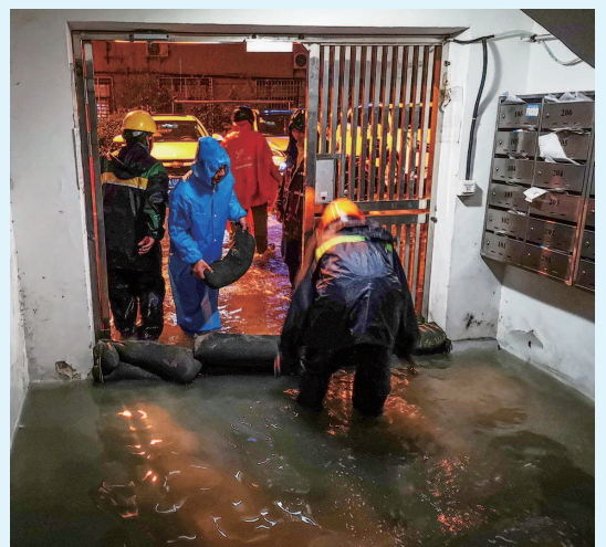
■ 昨晚,应急抢修人员及时排水抢险