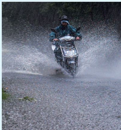
■ 昨天下午,沪杭公路积水