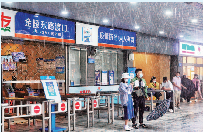
■ 昨天,金陵东路轮渡因台风影响停航