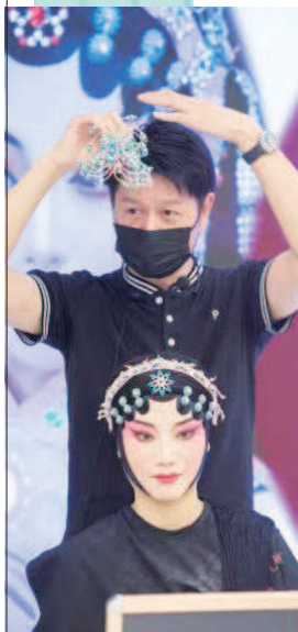
■ 去年艺术体验日活动场景