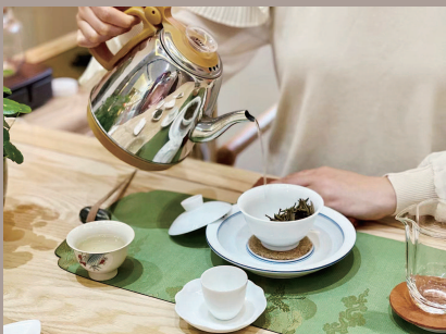
■ 市民艺术夜校往届资料图