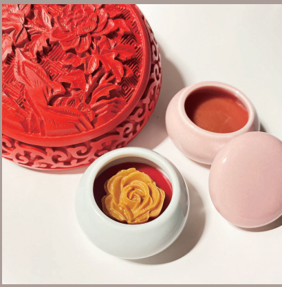
■ 市民艺术夜校往届资料图

苏州河畔、上海大世界、上海淮剧团……一系列地标场馆将成为上海市市民艺术夜校的新教学点。今天，上海市市民艺术夜校推出秋季课程表，将通过线上线下联动教学，首次实现上海16个区全覆盖。8月18日启动网上招生报名工作，市民可及时关注“上海市群众艺术馆”和“乐游上海”官方微信号进行报名。