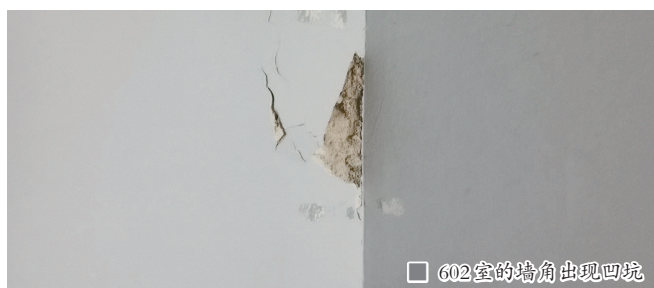
602室的墙角出现凹坑