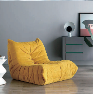
▲ 坐感舒适的Togo泡棉沙发