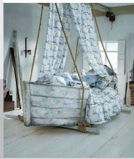
▲ 在家也能“扬帆出海”的船床