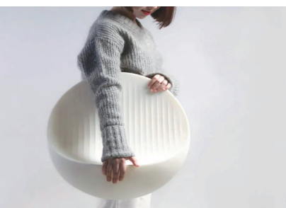
▲ 体态轻盈的摇摆落地椅