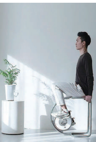
▲ 简约迷你的“The-O”动感单车

事实上,为了让家居生活更舒适,人们会迸发出惊人创造潜力的,不只是职业设计师,人人都能成为自己的设计师。心灵手巧的人在客厅里搭出了秋千椅,找回了童年的快乐。船模收藏者用老旧木船头给自己量身定制了一张船床,在家里也能“扬帆出海”。如果是绿植和象棋爱好者,那也好办,为绿植们造一个棋盘,摆一局“绿植对弈”,同样别具趣味,令人难忘。