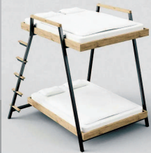
▲ 调节为双层的“f=mg”多层卧床