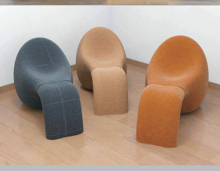
▲ 只有两个基本组件的无限椅