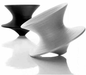
▲ 英国设计师托马斯·赫斯维克设计的陀螺椅