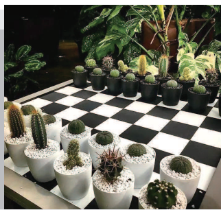
▲ 为绿植造棋盘,摆一局“绿植对弈”