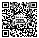
扫一扫,关注“夜光杯”

夏至已过,在这个时节,有一种夏花的出场是相当高调而吸引人们注意的。这种花,就是栀子。