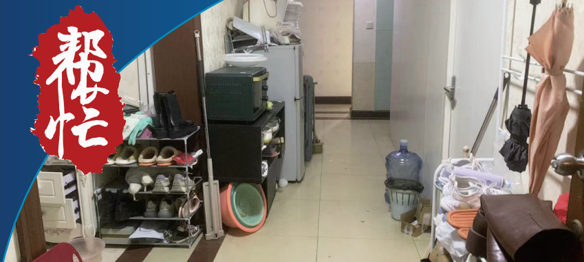
■ 901室的客厅隔出4间房,玄关处拥挤逼仄