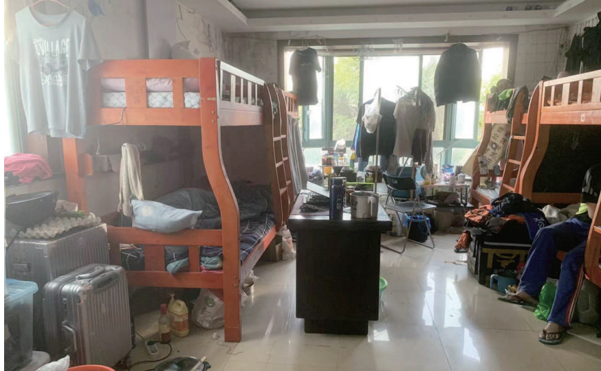
■ 903室内仅客厅就塞进4张高低床,地上数根电线缠绕在一起,存在安全隐患