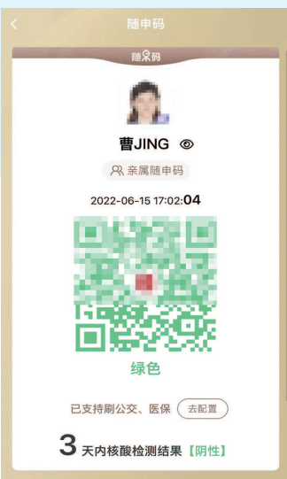
■ 曹女士的随申码名字已修正