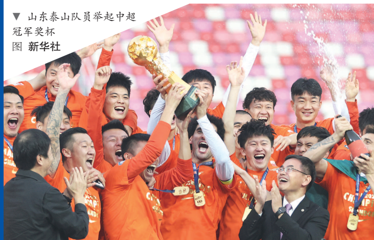
▼ 山东泰山队员举起中超冠军奖杯

球队核心奥斯卡在总结2021赛季时表示:“这一年我们遇到了很多困难,有很多伤病,也启用了很多年轻球员,能取得第二名的成绩,我还是满意的。”