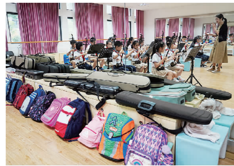
9月1日新学期首日,“双减”政策实施后,上海音乐学院实验学校民乐团的孩子们放下书包,打开琴包,利用放学后的时间进行排练,用各种民族乐器奏出悦动的音符