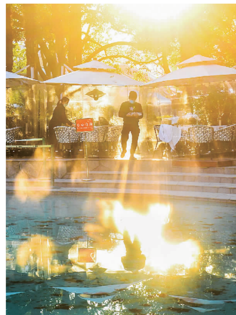
随着本轮冷空气影响结束,中城气温有所回升。12月2日下午,静安公园内,午后和煦的阳光洒下,照亮了四周的薄雾,让人温暖舒适。冬天来了,春天还会远吗?期待2022,愿“寒冬”早日过去,未来如诗