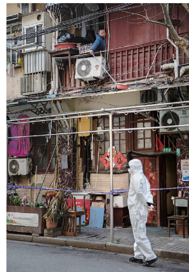
1月27日凌晨,黄浦区复兴中路113弄小区周边拉起警戒线,进行封闭管理。警戒线外,“大白”日夜巡查,让人安心;警戒线内,居民生活依旧,淡定如常。如今,在疫情防控常态化下,继续坚持“三件套”“五还要”,生活依旧美好