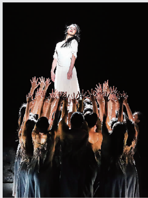
9月3日晚,为纪念中国人民抗日战争暨世界反法西斯战争胜利76周年,舞剧《记忆深处》在大宁剧院上演并开启全国巡演序幕。2021,有些故事暂时落下帷幕,有些序章却刚刚开始,我们满怀爱与希望,憧憬着2022到来