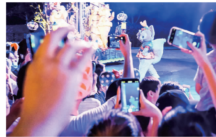
10月9日,上海迪士尼乐园内,被称为“川沙姐”的玲娜贝儿的出场引来欢呼,这只粉色小狐狸今年红透了半边天。这是一个网红辈出的时代