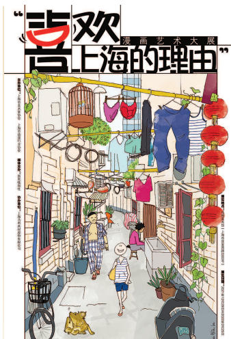
《老弄堂》露西·古雅德(法国)