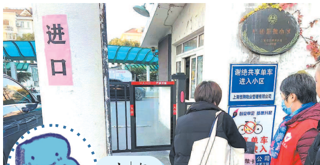
■ 小区门禁系统终于启用了

本报讯（记者 夏韵 实习生 刘嘉怡）12月6日，本报刊发了《门禁成摆设 迟迟不启用》的报道，反映浦东新区关岳路229弄汇丽苑行人门禁安装多年，一直没有投入使用，不少设备甚至已经损坏。