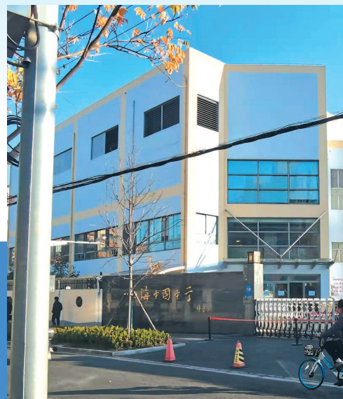
▲ 马路两侧有多所学校，包括上海中国中学、康宁科技实验小学、紫薇实验幼儿园等