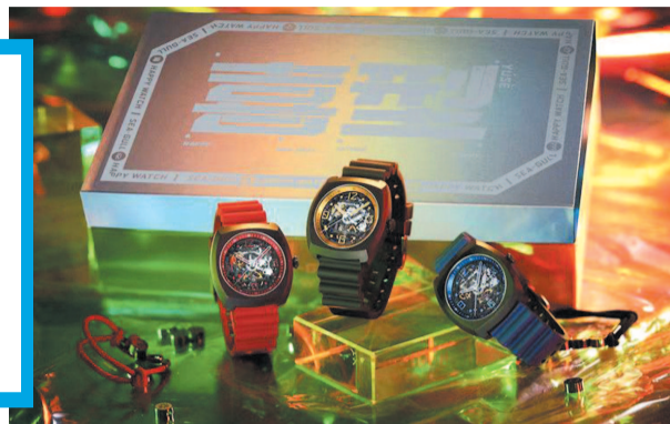
◀ 中国第一块国产手表 ▲ 专为年轻人打造的海鸥全新潮表系列“喜型于色”

“海鸥”,是做出中国第一块国产手表的老字号。如今,它的主要客户是怀旧的中老年人吗?并不是。记者从新电商平台了解到,购买海鸥手表的人,85%是90后。这背后,是老字号“年轻化”破圈的新尝试。