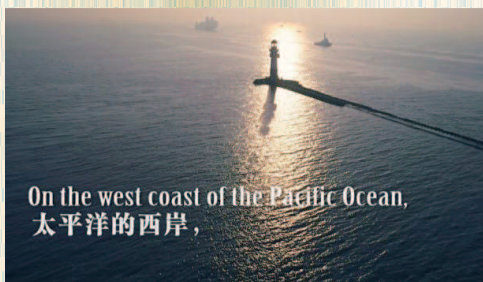
On the west coast of the Pacific Ocean, 太平洋的西岸,