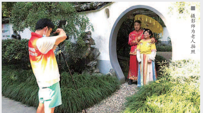
摄影师为老人拍照