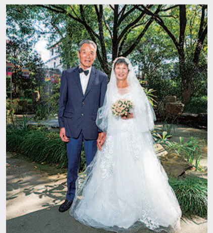
老人拍摄金婚纪念照