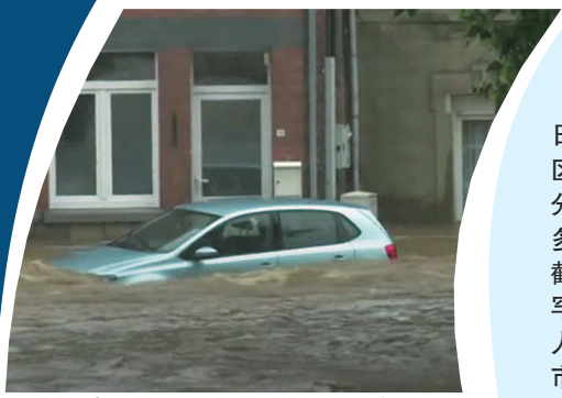
● 洪水灌入瓦隆大区列日省部分城镇,街道变成河流