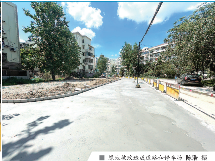
绿地被改造成道路和停车场