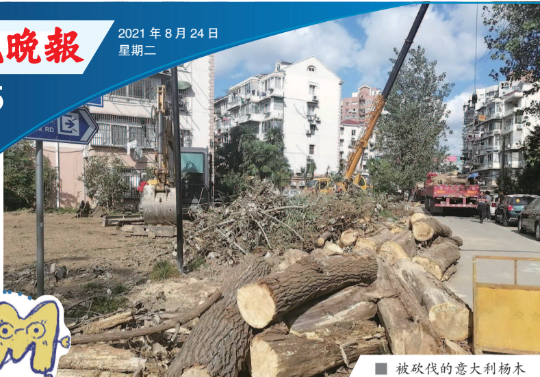
被砍伐的意大利杨木