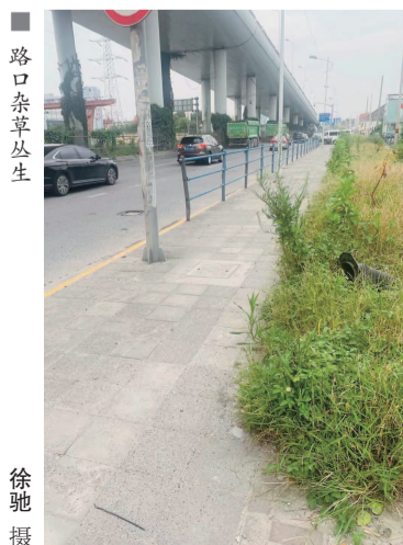
路口杂草丛生

市民杨先生反映，杨浦区翔殷路军工路口杂草丛生、淤泥堆积，给周边居民出行带来不便。