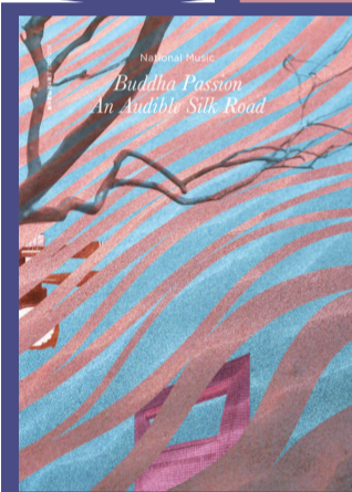
■ 国乐《敦煌·慈悲颂》海报