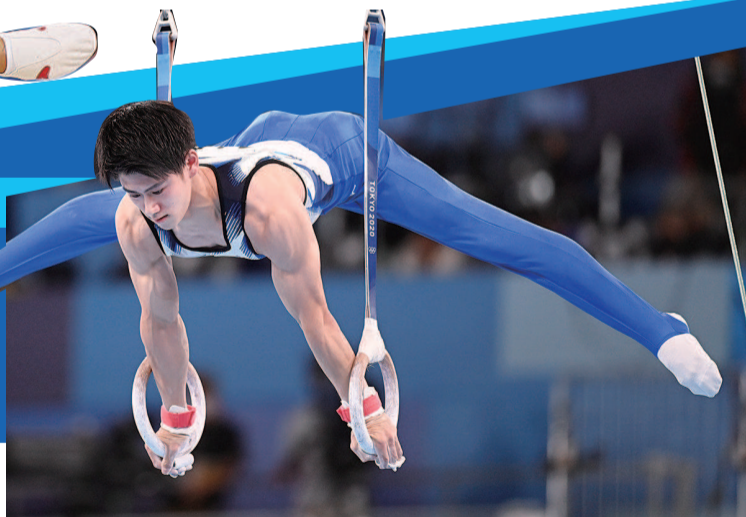
桥本大辉在吊环比赛中

2019年世锦赛日本队的阵容，他也成为继白井健三之后第二个完成此壮举的选手。当时的他，肩负着无数人的期望。但成长的道路永远不会一帆风顺，在斯图加特的赛场上，桥本四个单项的预赛成绩都排在队内第一，然而到了决赛，内心的紧张和身体的伤病影响了他的发挥，男团决赛中的连续失误，更导致日本男团无缘奖牌。备受瞩目的新星与不堪大任的“菜鸟”之间，只隔了短短十几天。