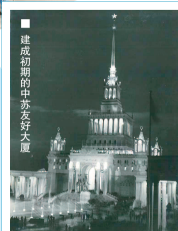
■ 建成初期的中苏友好大厦