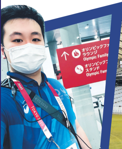
东京体育场及其他奥运场馆都有许多热情的志愿者