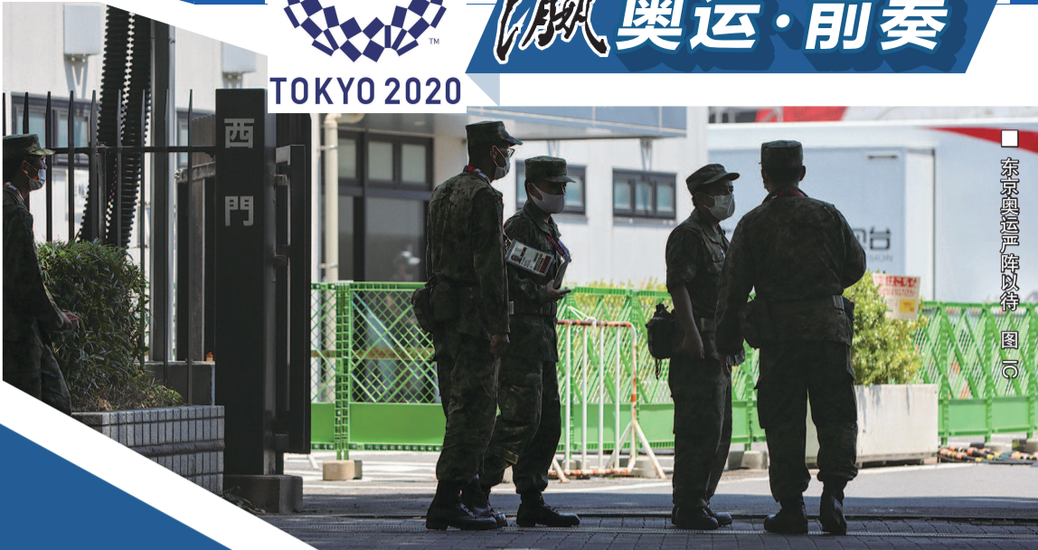
东京奥运严阵以待 图 6

日本当地时间7月18日晚抵达东京后,本报特派记者首先经历的是从次日开始计算的3天酒店隔离期。一天的隔离生活,一冷一热的遭遇让记者感受到了日式防疫的细致与弹性。在如此特殊环境下举办的奥运会,对主办方和参与者而言有了太多“头一遭”。