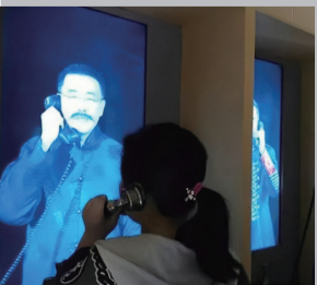
■ 沉浸式“公用电话亭”

有造诣的设计师曲宇道出了“沉浸式”红色文创的门道。引入人体感应、虚拟现实等技术，的确能给人带来新奇体验，但是要做好一款作品，真情实感仍是最核心的因素。