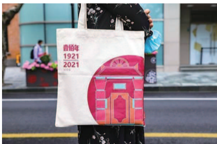
■ 以建党百年为题材的帆布袋