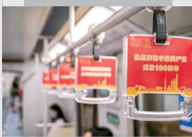
■ 红色主题地铁专列

营造“党的生日，人民的节日”良好氛围，打响上海红色文化品牌，红色文创正用创意和实力“出圈”出彩。