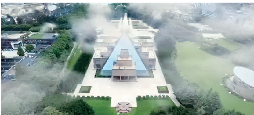
■ 《龙潭英雄》AR游戏中的场景

沪上红色文创引人入胜，这背后有设计师的创意灵感助推，有高科技的助阵，更关键的是穿越时空、永不褪色的革命精神对人们的感召力和感染力。