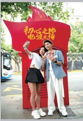
■ 有旗帜和火焰形象的电话亭