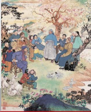
▲ 程十发《歌唱祖国的春天》