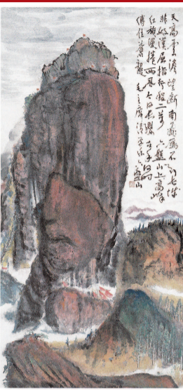
▲ 钱瘦铁《毛主席六盘山词意图》