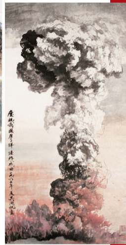
▲ 吴湖帆《庆祝我国原子弹爆炸成功》