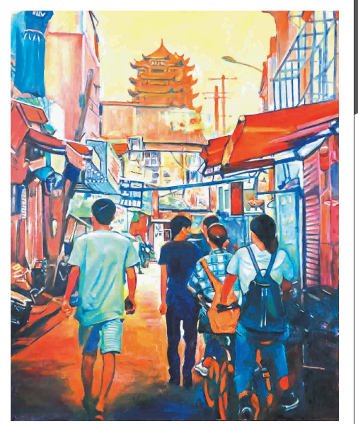
风雨之后 油画 杨继仁