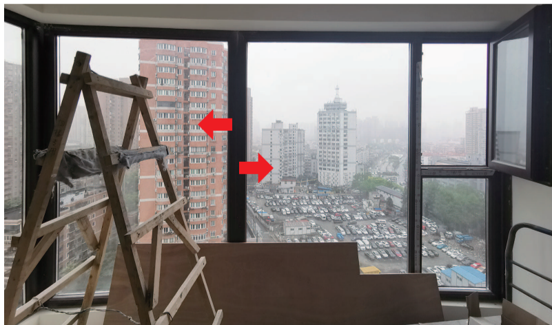
高两米多的玻璃推一推“抖三抖”

市民冯女士向“帮依忙”反映，自家客厅新安装的富贵花F70系列窗，稍微用力一推，整扇玻璃窗竟然有节奏有弹性地“抖三抖”，连同开窗也一起“晃三晃”，抖动、晃动的幅度大到清晰可见。而她家位于15楼高层，窗玻璃如此不稳固，真是“想想都怕”。