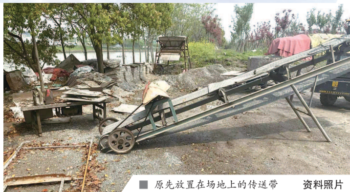
原先放置在场地上的传送带 资料照片