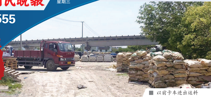
以前卡车进出运料