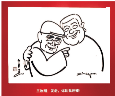
《纪念程十发先生百年诞辰》 郑辛遥 (上海)