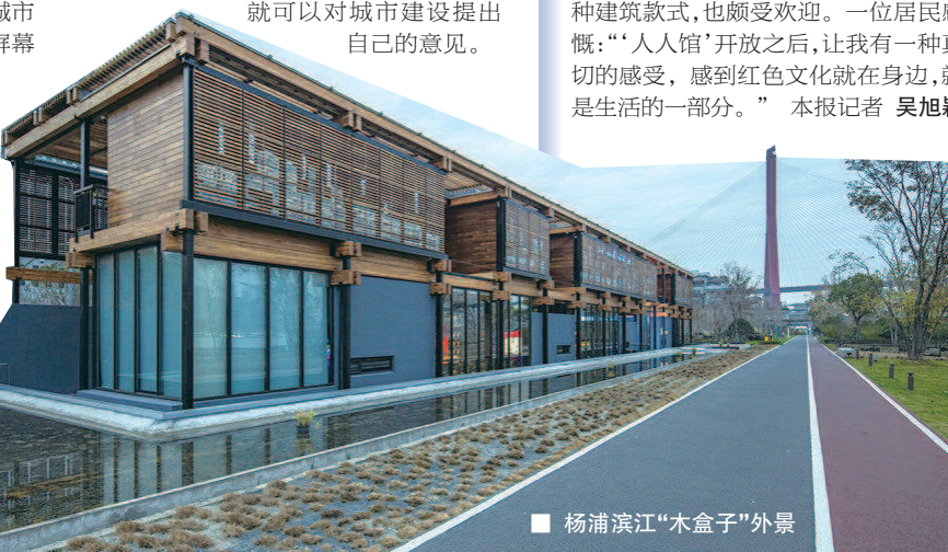
■ 杨浦滨江“木盒子”外景

辈的动人故事,漫游工业遗产博览园,观看“曙光——红色上海·庆祝中国共产党成立100周年主题艺术作品展”……制作节目之余,这块场地也常常被用于举办党课等活动。馆内还设有“人民建议征集平台”,市民只需扫描二维码、注册账号,就可以对城市建设提出自己的意见。