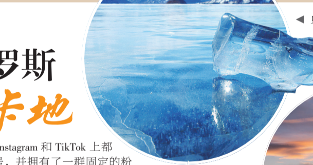
贝加尔湖春天的冰面