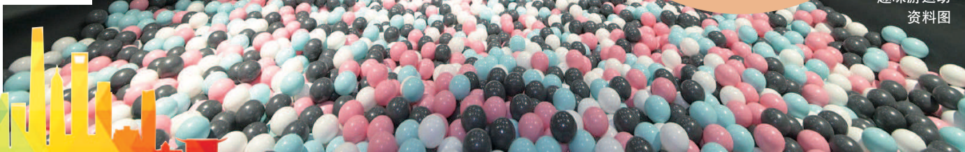
趣味游运动 资料图

店址:上海市浦东新区新金桥路738号 交通便捷指数:★★★★☆ 乘轨交9号线至台儿庄路站,从2号口出步行千余米即可抵达。也可自驾前往,目前停车免费。 价格指数:★★★★☆ 商场内入驻的多为价格亲民的品牌,开业初期,Asobi Park PLUS,VS PARK的门票价格均有优惠活动。 服务亲和指数:★★★★☆ 店员服务态度亲切友善,目前商场内店铺尚未全部开业,餐饮方面选择较有限。